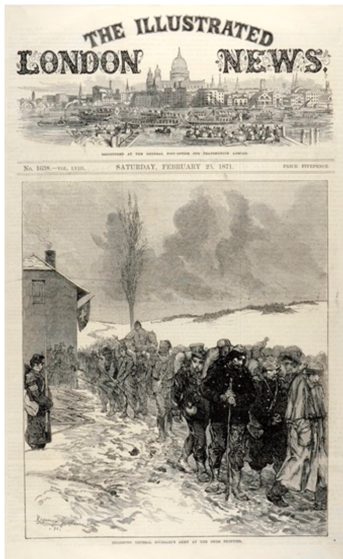
Fig. 9: L'écho des médias - L'arrivée de l'armée du général Bourbaki aux Verrières en titre du «The Illustrated London News».

À l'époque de la guerre franco-allemande, les photos sont encore loin de remplacer les dessins dans les reportages. Il n'est pas possible de photographier les actions en mouvement, et il n'est pas possible de représenter des nuances de gris dans les journaux. En ce qui concerne l'internement de l'armée Bourbaki, cela signifie que le passage des interminables colonnes de soldats sont représentées dans des dessins et tableaux. Les Bourbakis ont toutefois été photographiés dans leurs abris, à l'infirmerie ou dans un atelier photo.