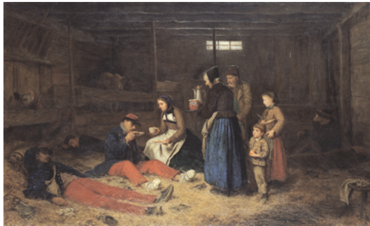
Fig.8: Tableau d'Albert Anker «Hospitalité Suisse»