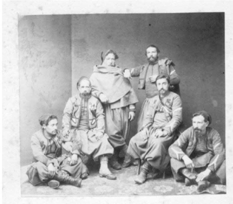
Fig. 10: Des personnes internées à Lucerne, photo de groupe dans un studio