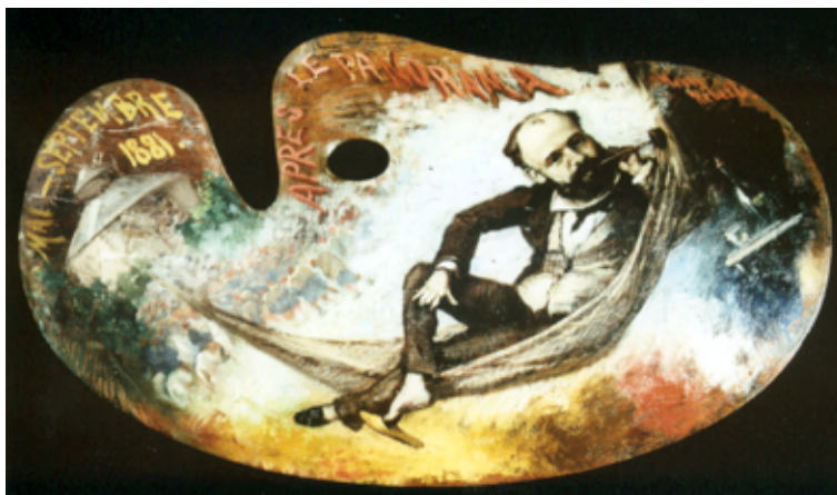
Fig. 15: Septembre 1881 - L'œuvre est terminée, le maître Edouard Castres se repose. Palette de peintre de l'atelier Castres

La peinture de tableaux panoramiques a déjà une longue tradition à la naissance du panorama Bourbaki. Dans le courant du 19 e siècle, une véritable industrie du spectacle se développe. Des sociétés par actions sont créées autour du globe, consacrées à la confection, la présentation et la commercialisation de tableaux panoramiques. Ce sont des entreprises commerciales à but lucratif. Cependant, pour qu'un tableau panoramique apporte un bénéfice, il faut attirer suffisamment de visiteurs. Et les visiteurs ne viennent en grand nombre que si l'on a des images intéressantes à montrer. Les créateurs de panoramas doivent donc se poser la question au préalable qui sera son public, et qu'est-ce que ce public aura envie de voir. Les images qui en résultent ne reproduisent pas exactement les vérités historiques. Le panorama se rapproche uniquement des faits, mais il est adapté au goût du public. En conséquence, on ne doit pas tout croire, ce que l'on voit sur une image panoramique! Il s'agit d'une œuvre d'art commercialisée.